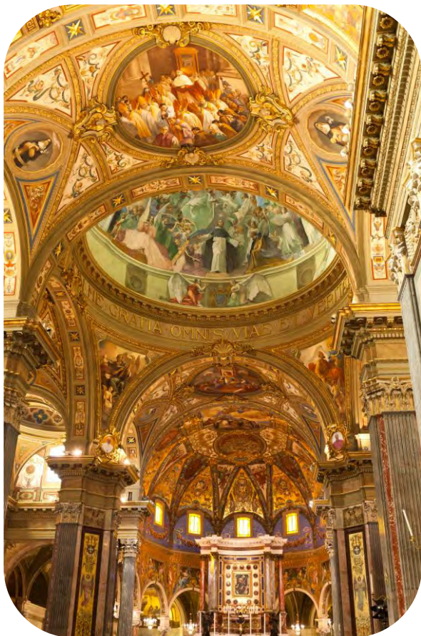
Rosenkranzbasilika in Pompei