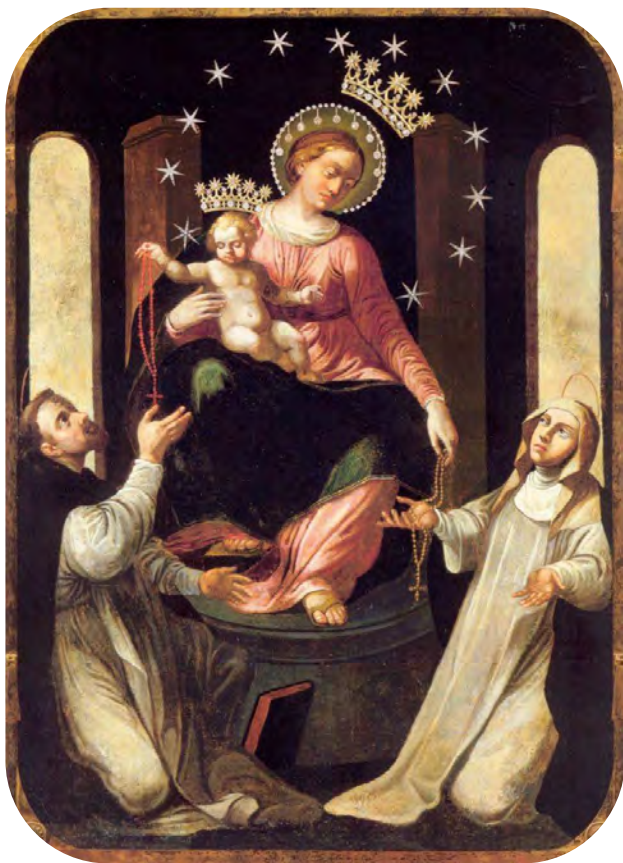
Das Gnadenbild Unserer Lieben Frau von Pompei