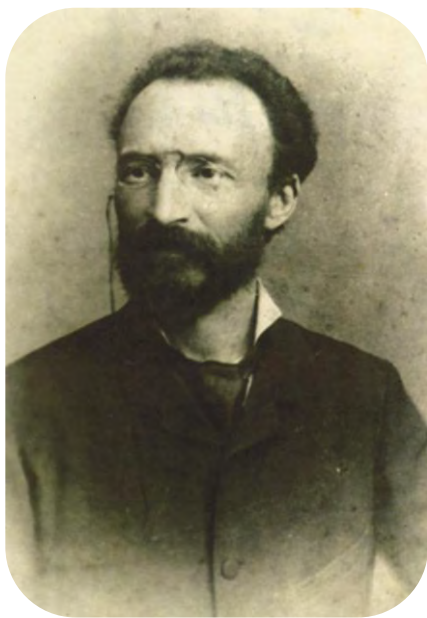
Bartolo Longo im Alter von 35 Jahren

Der heilige Bartolo Longo griff diese Eingebung auf und verfasste die begleitenden Gebete – nicht am Schreibtisch, sondern schwer krank zu Füßen des Gnadenbildes in der Basilika von Pompei. Er selbst wurde durch diese Novene auf wunderbare Weise geheilt, als alle menschliche Hoffnung bereits geschwunden war. Seine Gebetstexte zeugen von tiefer Not und zugleich von kindlichem Vertrauen zur Rosenkranzkönigin.