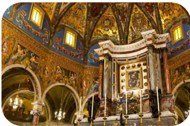
Das Innere der Basilika